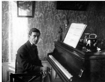
Ravel am Klavier 1912.