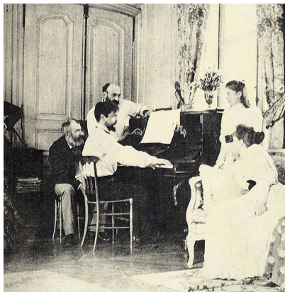
Debussy am Klavier 1893 im Haus von Ernest Chausson.

Die französischen literarischen Symbolisten suchten die Musik in der Sprache: „de la musique avant toute chose“ sollte die Dichtung sein – „vor allem Musik“ –, so forderte Verlaine in seinem Gedicht Art poétique . Das, was jenen jedoch schwerfiel – ein geeignetes Ausdrucksmittel für Eindrücke und Gefühle zu finden – meinte Debussy in der Musik erreichen zu können: „Musik hat gegenüber der Malerei den Vorteil, daß sie alle möglichen Variationen von Farbe und Licht zusammenbringen kann“,